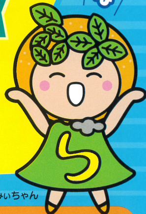
イメージキャラクター みいちゃん

下記のいずれかの《ご返済シミュレーション》《共済お見積り》をいただいた方。 または、当JAへ《公的年金の手続き》をいただいた方へ素敵なチャンス！