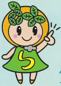
イメージキャラクター みいちゃん