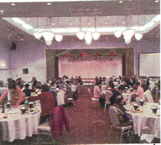
去年の年金友の会旅行の 写真です。

昨年度も開催した年金友の会の旅行を 今年も10/1(金)に開催致します！昨年度は たくさんのご参加ありがとうございました。ま た今年もたくさんのご参加をお待ちしております。 よろしくお申し込みください！！何かおから しいと聞いてお申し込みしたら、お気軽に お声かけ下さい！！