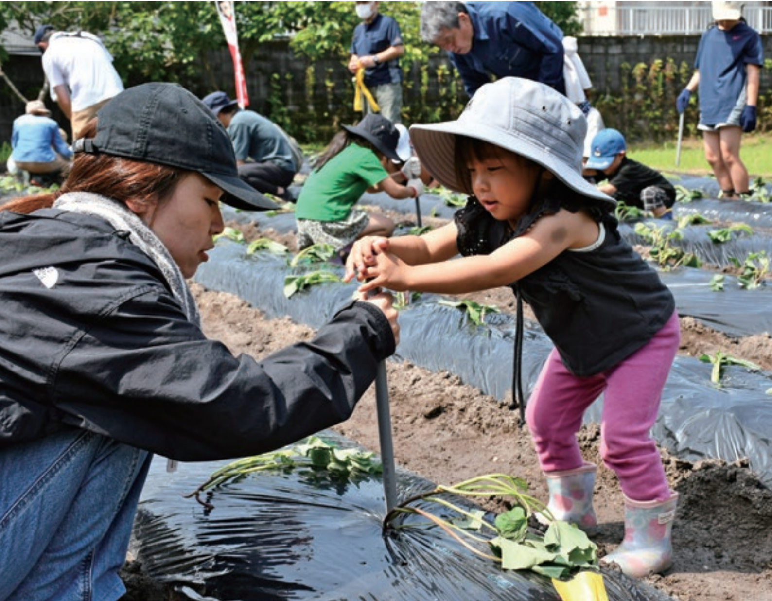
山田下サツマイモ苗定植・P12