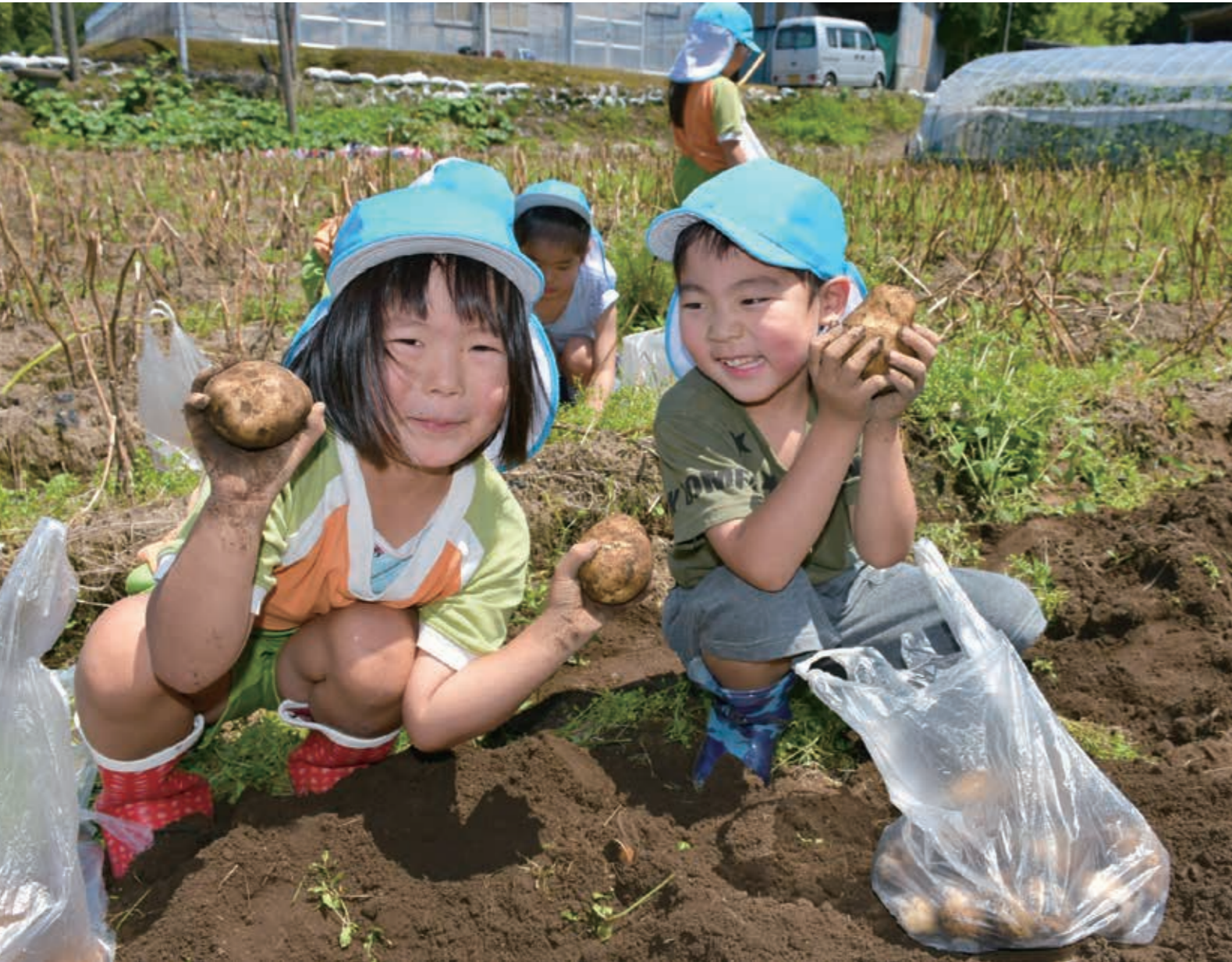
錦ヶ丘幼稚園ジャガイモ収穫 (P3)